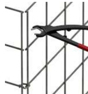
Spezialzange notwendig Preis für Zange 58,40€

Folgende Optionen sind gegen Mehrpreis ebenfalls möglich: