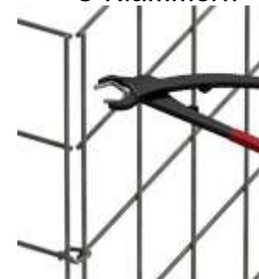
Spezialzange notwendig Preis für Zange 58,40€

Folgende Optionen sind gegen Mehrpreis ebenfalls möglich: