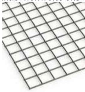
Böden, Trennwände MW 5x10cm