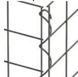
einfaches eindrehen per Hand