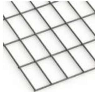
Böden, Trennwände, Zwischendeckel 10x10cm