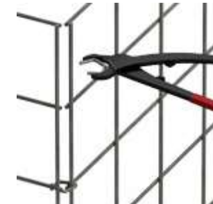
dezente Optik Spezialzange notwendig Preis für Zange 50,42€

Folgende Optionen sind gegen Mehrpreis ebenfalls möglich: