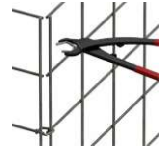
dezentere Optik Spezialzange notwendig Preis für Zange 58,40€

Folgende Optionen sind gegen Mehrpreis ebenfalls möglich: