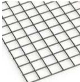
Böden, Trennwände, Zwischendeckel MW 10x10cm