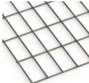
Böden, Trennwände, Zwischendeckel MW 10x10cm