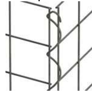
einfaches eindrehen per Hand