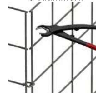
dezente Optik Spezialzange notwendig Preis für Zange 50,42€

Folgende Optionen sind gegen Mehrpreis ebenfalls möglich: