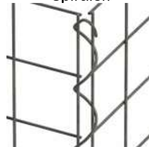
einfaches eindrehen per Hand