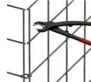
dezentere Optik Spezialzange notwendig Preis für Zange 46,22€

Folgende Optionen sind gegen Mehrpreis ebenfalls möglich: